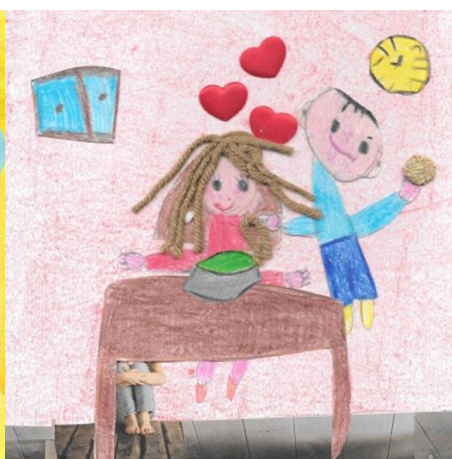
Esempio disegno 2